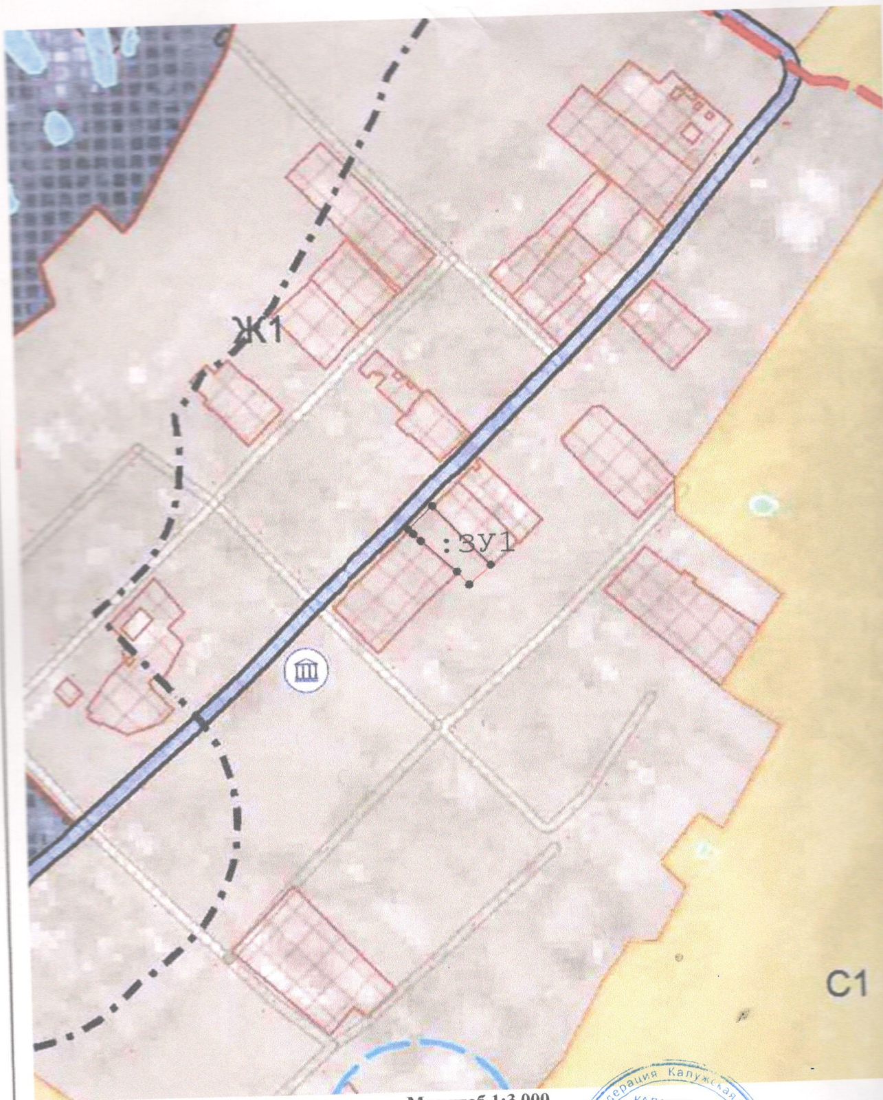
Схема расположения на карте функционального зонирования территории