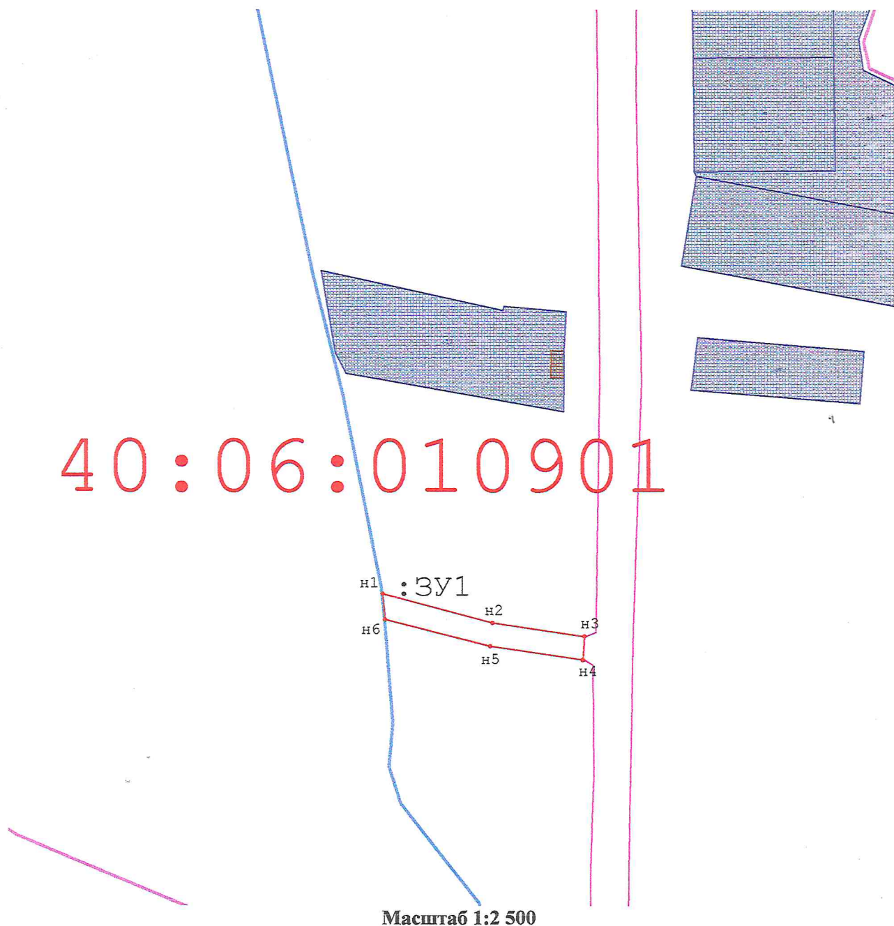
Схема расположения земельного участка на кадастровом плане территории